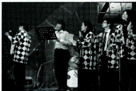
バンド演奏で盛り上げた。

「ジェイブレイン」を立ち上げており、15周年を経て今後は、新会社を通じて今後、新会社を通じて上流(CAD等)から下流(めっき処理等)の共同一括受注を目指す。また超一級のエンジニア、CADオペレーター、技術経営人材などモノづくり人材の育成事業にも取り組んでいきたいと