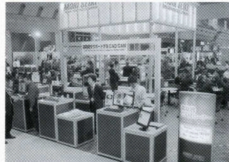
写真9 森精機ブース内に設けられた“CAMコーナー”。MasterCAM、HyperMILL、EdgeCAM、ESPRIT、WorkNC、GibbsCAM、UnigraphicsNXの7製品のボックステーブルが並べられた。