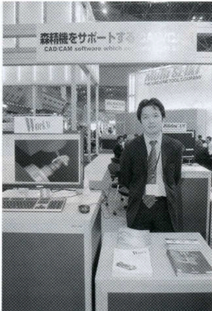
写真8 森精機ブースCAMコーナーでの(株)データ・デザインによるWorkNCの製品紹介。