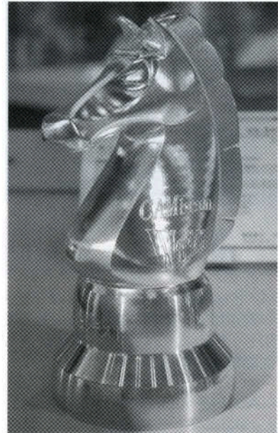
写真10 東京都江戸川区のWorkNCユーザーである(株)キャムブレーンは、森精機の5軸加工機「NMV 5000 DCG」を使って製作した同時5軸加工の特性を最大限に追求した切削サンプルを「切削業界のサラブレッド」という作品名で切削加工ドリームコンテストに出展した。入賞は逸したが、試みとして面白い。 同時5軸切削サンプル「切削業界のサラブレッド」 材質：AL 5052、ワーク高さ：100 mm